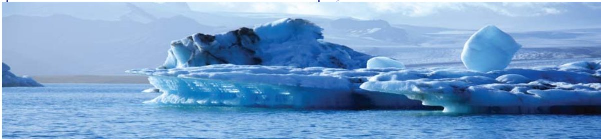
Сажа (углеродные частицы) – одна из главных причин изменения климата в Арктике.

Translated from English into Russian by Ilya Mishchenko, Ecojuris Institute (Moscow, Russia) April, 2009