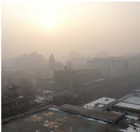
Сажа – основной виновник коричневых облаков, которые часто покрывают завесой города Азии.