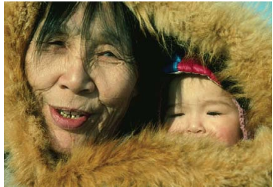
По мере потепления в Арктике коренные народы первыми попадают под удар.

К примеру, поскольку выбросы от неэффективного сгорания ископаемого топлива содержат существенно больше сажи, чем органического углерода, снижение таких выбросов – это исключительно сильнодействующая стратегия минимизации ущерба 7 . Автомобильные и не связанные с транспортом "дизельные" выбросы, а также продукты процесса горения в некоторых видах промышленности являются особенно важными источниками сажи в Северной Америке и Европе, в то время как в Азии также отмечаются большие выбросы от систем жилого отопления и в связи с приготовлением пищи, сжигания угля в энергетике и промышленности 8 . В Арктике выбросы сажи от дизельных транспортных средств и генераторов, горения нефти и газа, а также морского транспорта наносят значительный удар 9 .